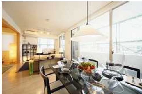
Dタイプ (リビングダイニング)

～毎週土・日は、現地にて実際のお部屋見学会開催中！～ 全タイプのモデルルームをご覧いただけます