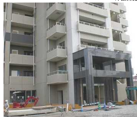
エントランス部分

皆様にご満足される住まいを提供させていただくには、工事に携わる方々と販売に関わる私共の双方が同じ思いでなければならぬと感じております。ガーデンプレイスは数え切れないほど多くの方々の手によって、まもなく完成を迎えるようしております。是非、一人でも多くの方に見学会にお越しいただきたいと思っておりますし、グランディアならではの快適なマンションライフをご実感いただけますと嬉しく思います。