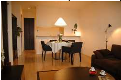
Cタイプ (リビングダイニング)

『グランディアガーデンプレイス』では、6月6日(土)より毎週土・日曜に現地モデルルーム見学会を開催致しております。AタイプからEタイプまで、75㎡(3LDK)から99㎡(4LDK)までの全タイプのお部屋をご覧頂けますので、是非お気軽にご来場下さいますようお願い申し上げます(詳細下記)