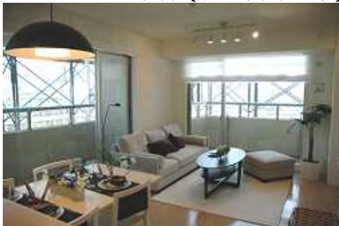
Eタイプ (リビングダイニング)